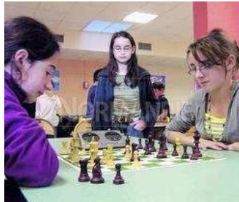
La concentration est à son maximum lorsqu'il faut se départager